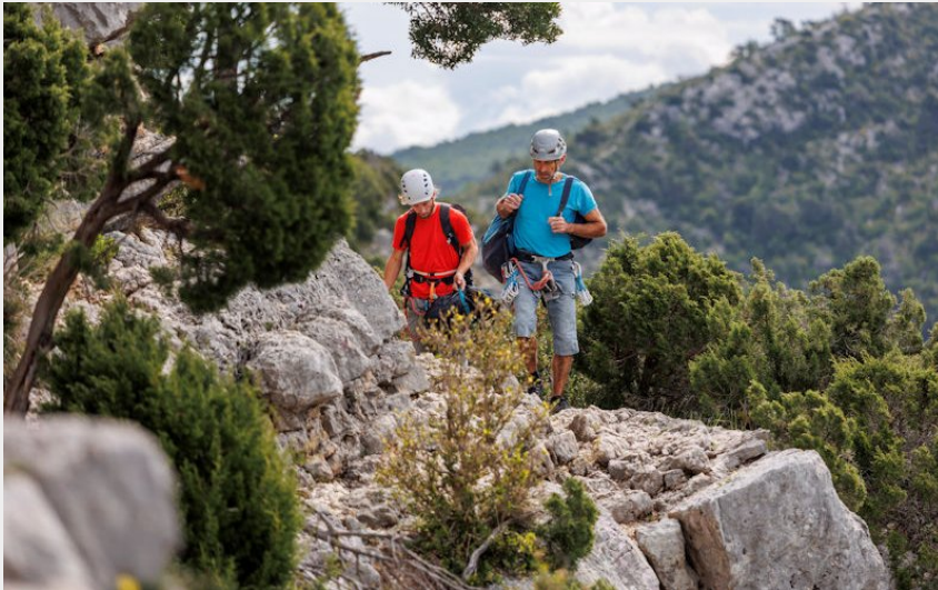
Accès au site d'escalade du col d'Ayen (Thibaut Vergoz)