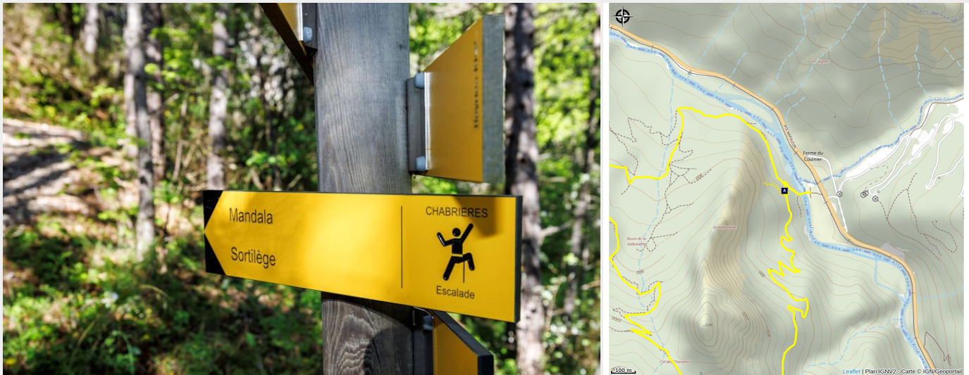
Signalétique sports de nature au site naturel d'escalade de Chabrières

Marche d'approche de 0,4 km signalée par des panneaux sports de Nature.