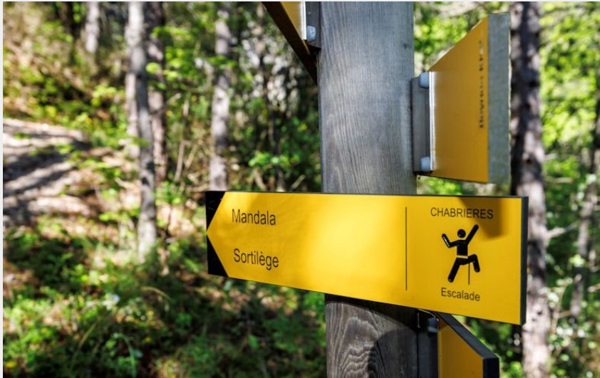
Signalétique sports de nature au site naturel d'escalade de Chabrières