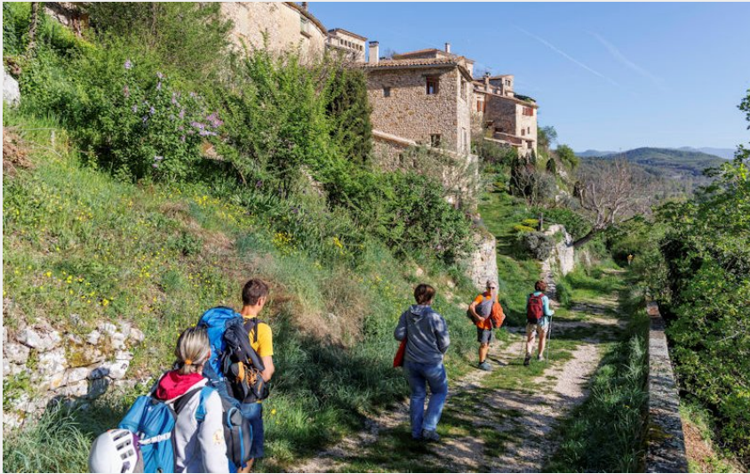
Escalade au Refour d'Oppedette (Thibaut Vergoz)