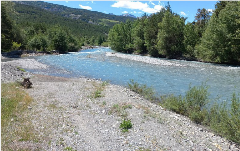
Rampe d'accès à l'aire de débarquement du Pont de Barnuquel (JS-CD04)