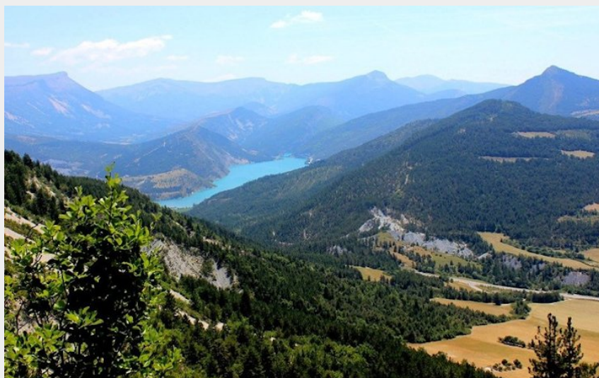
Sommet de Chalvet (Guillaume Pluchon - PNRV)