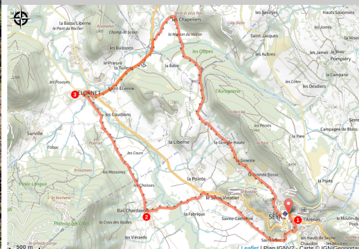
VTT Seyne-les-Alpes (Giovanni Conti - Ride The Track)

Un tour VTT sur pistes et routes à travers la plaine, ses hameaux, son château et la remarquable citadelle Vauban de Seyne-les-Alpes.