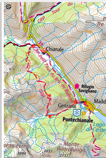
Col Rastel et Mont Viso (CDRP 04)

Cette quatrième étape étape, la dernière entièrement italienne, vous emmènera de Pontechianale à Chianale.