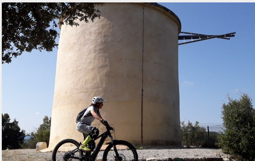
Moulin à vent (Eric Garnier)