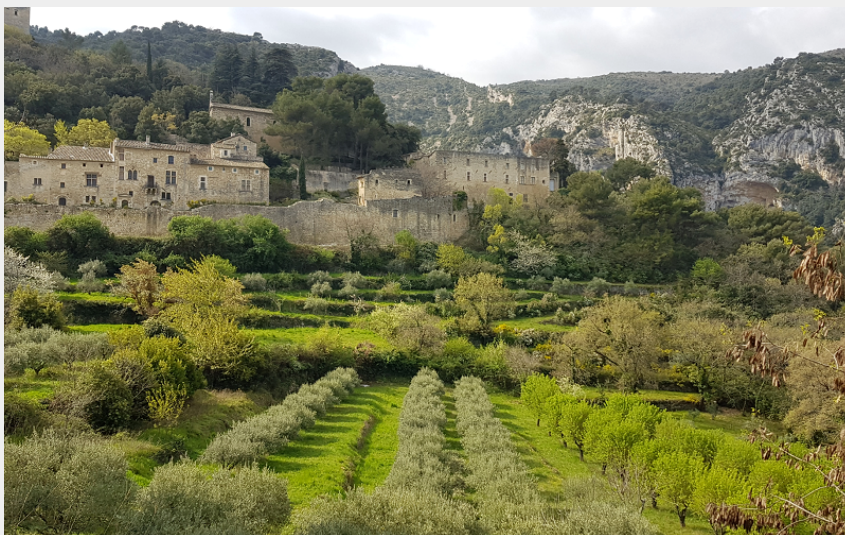
Cavaillon Apt_Autour du Luberon (Remi Leconte)