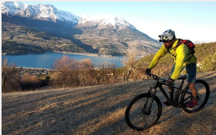
(PNE - Emmanuel Danjou)