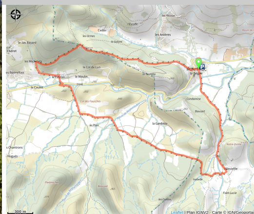
Sentier de la Biodiversité (CD04)

Découvrez le sentier thématique de Montfroc, au travers duquel vous serez imprégné des multiples senteurs de ce terroir. Un parcours riche en thématique, facile, pour toute la famille.