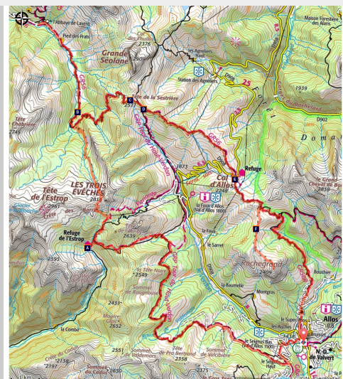
Tours du Haut Verdon - Rochegrand

La Haute Vallée du Verdon, en amont du célèbre grand canyon, appartient sans conteste au domaine alpin. Elle est bordée à l'ouest par les sommets de la Haute-Bléone, au nord, elle communique avec la vallée de l'Ubaye. A l'est, enfin, on découvre le Lac d'Allos et le Mont Pelat, joyaux du Parc national du Mercantour.