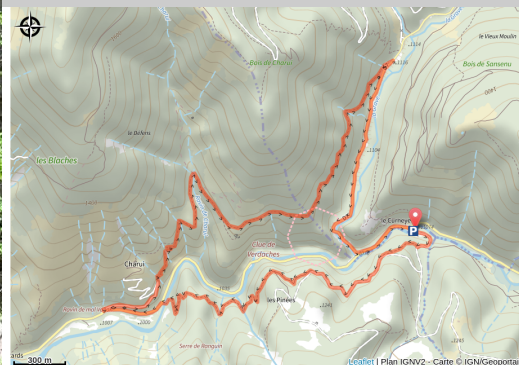
Cascade du saut de la Pie (JL - CD Alpes de Haute-Provence)

Balade en boucle par le versant ombragé des clues de Verdaches, la cascade du saut de la Pie et parmi les roches les plus anciennes du département.