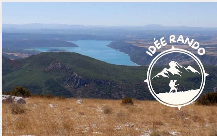
Vue sur le lac de Sainte-Croix