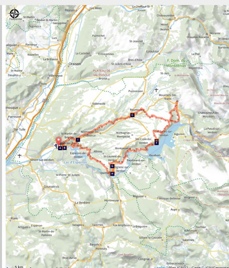
Plateau de Valensole