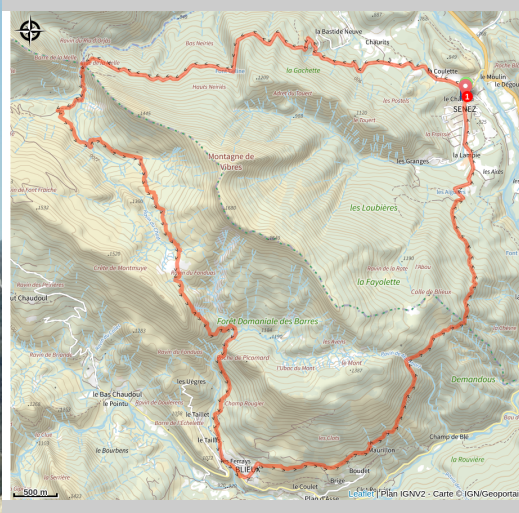
Montagne de Vibres, Senez

Grand parcours par Senez, la clue de la Melle et le sentier réhabilité en 2024 reliant Blieux à la Melle. Départ possible du village de Senez ou de Blieux.