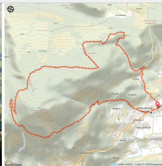
La Palud-sur-Verdon (Verdontourisme)

La randonnée offre des beaux points de vue sur les montagnes préalpines du Verdon et présente des contrastes de végétation intéressants entre l'adret et l'ubac de Barbin.