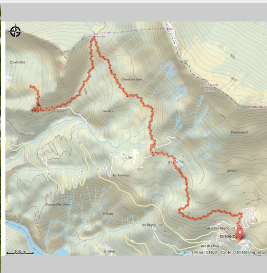
Hameau de Ville (Mairie de Demandolx)

Cette randonnée permet de visiter l'ancien hameau de Ville et sa chapelle de Saint Fortunat. Sur la crête dominant le site se dressait autrefois un château médiéval. La chapelle Notre Dame de Conche, but de la randonnée, offre un superbe panorama.