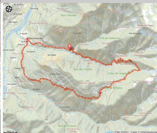
Chapelle d'Ondres (David Vogel)

Cette boucle offre un très beau panorama : gorges, forêts, cabanes forestières et enfin le village d'Ondres. Habité en été, il constitue une belle halte ombragée. Vous aurez peut-être le privilège d'observer des chamois.