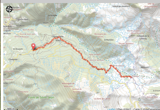
Col des Champs (M. Farig)

Parcours dans la forêt de mélèzes de Raterie avec passages dans les alpages puis les robines (terres noires). Arrivée au col avec splendide panorama tous azimuts (dont les Aiguilles de Pelens dans les Alpes Maritimes). Sentier à thème au col.