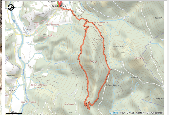
Saint-Lions - Tour du Clap (Patricia Mony)

Une magnifique balade pour toute la famille loin des lieux trop fréquentés. Un itinéraire boisé et ombragé qui offrira une belle ambiance de Haute-Provence.