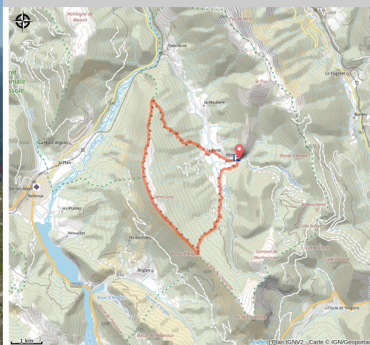
Allons - Crête des Serres (Mairie Allons)

Splendide randonnée, pour les pratiquants réguliers, qui saura vous ravir par son panorama à couper le souffle.