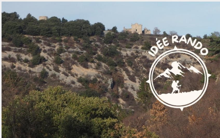
Simiane - Tour du Défens (Sylvie Parraud)