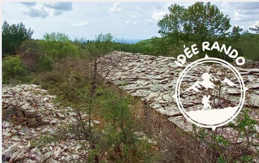
Bergerie (DB - CD04)