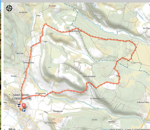
Balade de la Pierre (Adri 04)

A proximité du Centre d'Astronomie et de l'Observatoire de Saint-Michel-l'Observatoire, partez à la découverte de l'architecture en pierre caractéristique de la Haute-Provence telle que la chapelle St Jean, la tour de Porchères ou encore le site insolite des carrières de Mane.