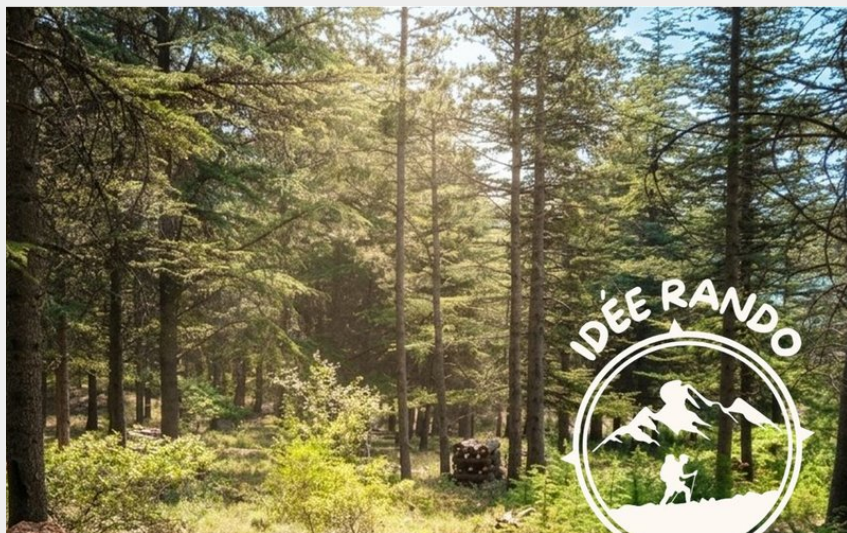
Sentier des 5 sens