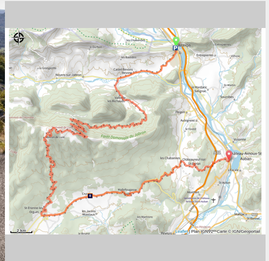
Ascension à vélo de la Montagne de Lure (Thibaut Vergoz (AD 04))