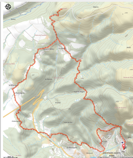
Le Castillon par les Baumes (OT Moustiers)

Le sommet du Castillon offre un très beau panorama sur le plateau de Valensole et la massif du Montdenier.