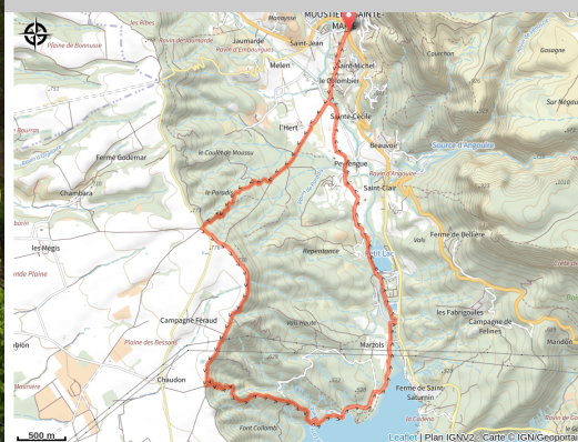
Lac de Sainte-Croix

Cette itinéraire offre de très beaux panoramas en surplomb du lac de Sainte-Croix.